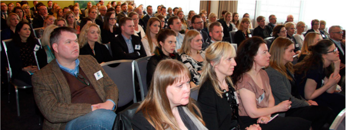
Málstofan um eftirlitshlutverk stjórnvalda var vinsæl.