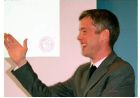
Eiríkur Jónsson stjórnaði málstofunni af röggsemi.