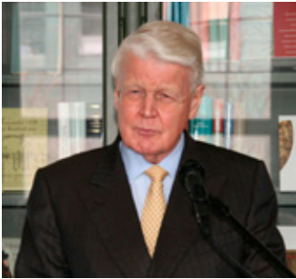
Ólafur Ragnar Grímsson.