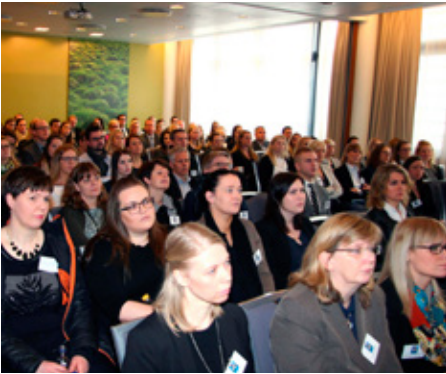
Fullt var úr dyrum á málstofunni.