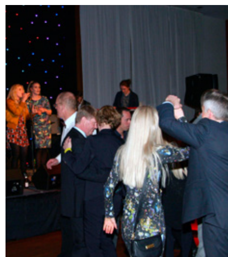
Amabadama fyllti gólfið með ljúfum reggie tónum sem fjalla um að hossa og dilla bossa, dansa og drekka vín. Það gerðu lögfræðingar landsins eitt vorkvöld að loknum lagadegi.