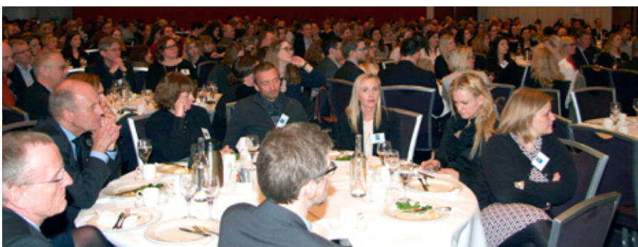
Um 500 manns sóttu aðalmálstofu Lagadagsins að þessu sinni.