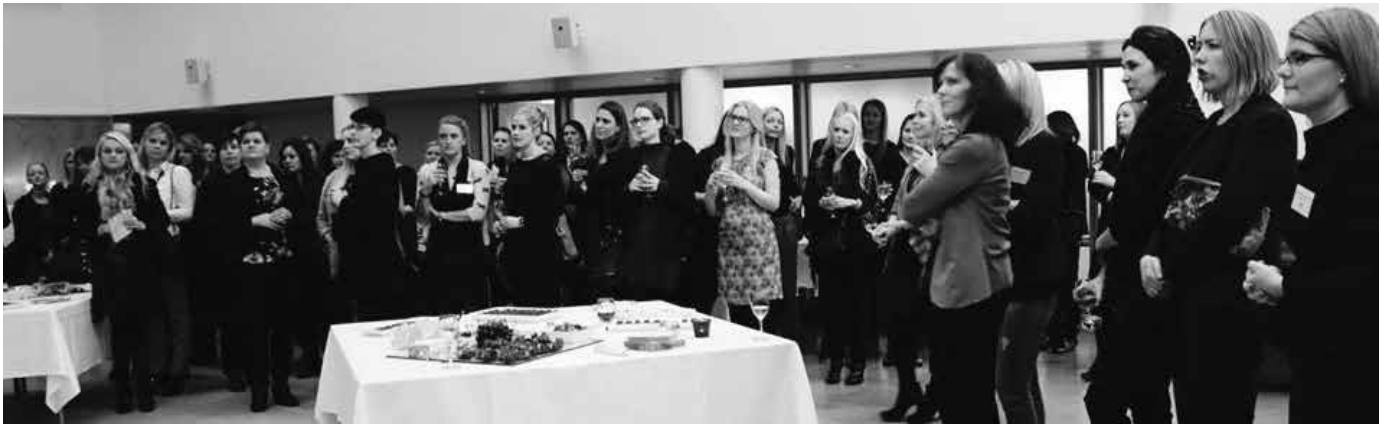
Frá móttöku FKL á LOGOS í febrúar.