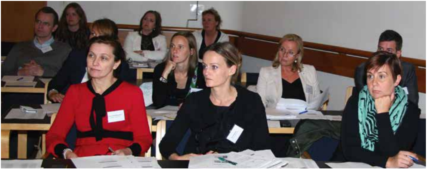
Á ráðstefnu um gjafsókn 5. september sl.