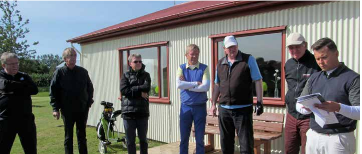
Keppendur í meistaramóti lögmanna rétt fyrir ræsingu á Garðavelli á Akranesi.