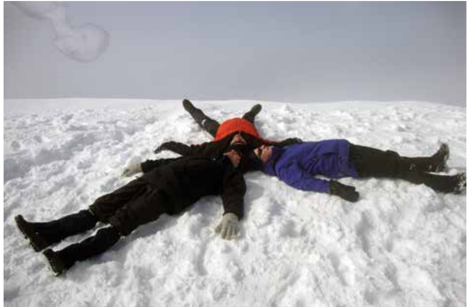
Þrír lögmennt lögðust í snjóinn á toppi Snæfellsjökuls með von um að verða numdir á brott af geimverum.

nægja að mynda sig með Norðurþúfu í baksýn í dásæmdar veðri á toppi veraldarinnar. Enn aðrir önduðu að sér orkunni sem á að vera á jöklinum, leituðu örlítið að leiðinni að miðju jarðar og litu grunsemdaraugum í kringum sig í leit að geimverum. Svo var um að gera að næra sig aðeins fyrir niðurleiðina.