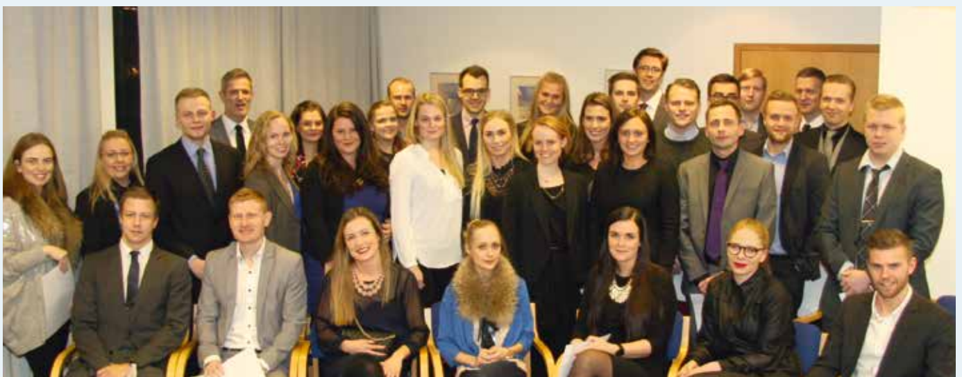
Að þessu sinni útskrifaðist 41 lögfræðingur.