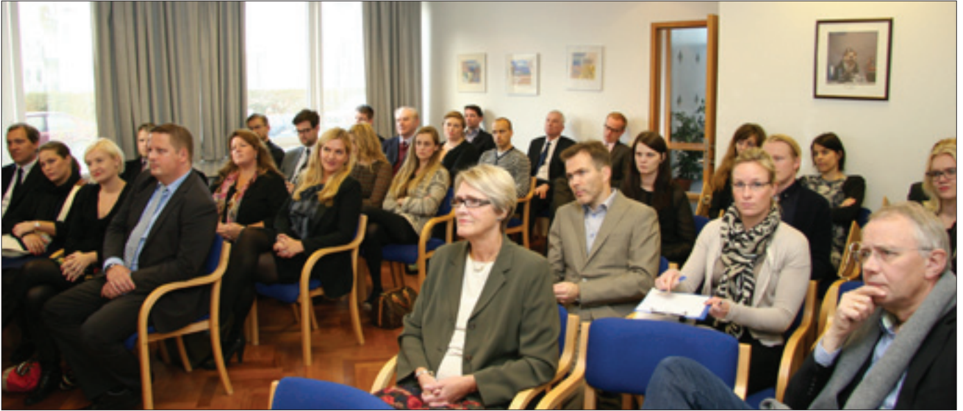
Á fimmta tug manna sótti fundinn.

samskonar bótaskyldu vegna brota á mannréttindum sem þau bæru ábyrgð á að tryggja.