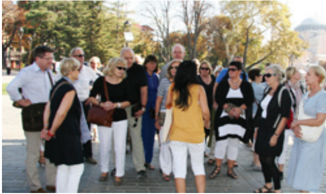
Ferðalangar hlusta með athygli á Selmu leiðsögumann í góða veðrinu í Istanbul en 30 stiga hiti var allan tímann.