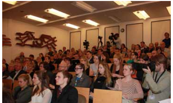
Fundurinn var einkar vel sóttur.