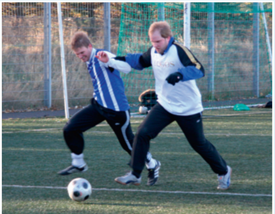
Barist um boltann.