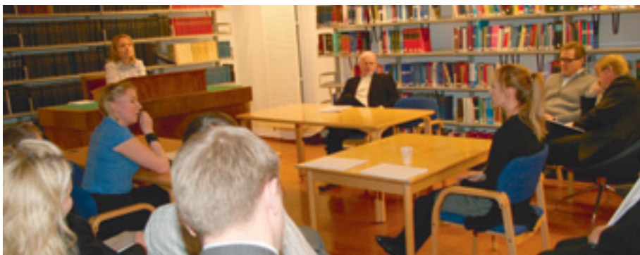
„Vitni“ spurt um málsatvik í réttarsal.

„Mjög fróðlegt að fylgjast með hvað vitni eru í rauninni „léleg“, t.a.m. það að veita ekki athygli fyrsta högginu frá konunni. Líklega göngum við öll út frá því að konur byrji ekki líkamleg átök og þeir fordómar okkar skila sér í því að við veitum slíku síður athygli.“