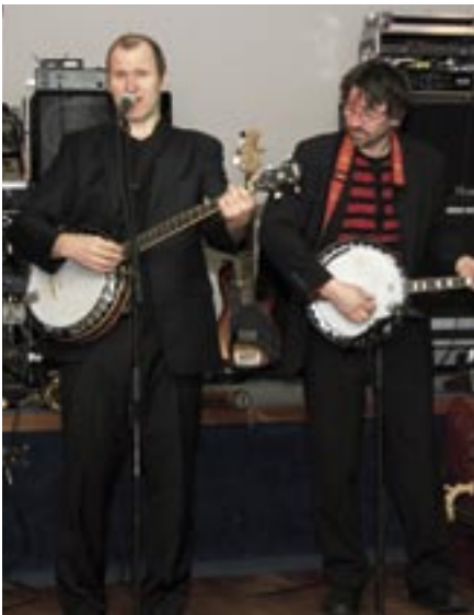
Hundur í óskilum brá sér bæjarleið og skemmti lögmönnum.