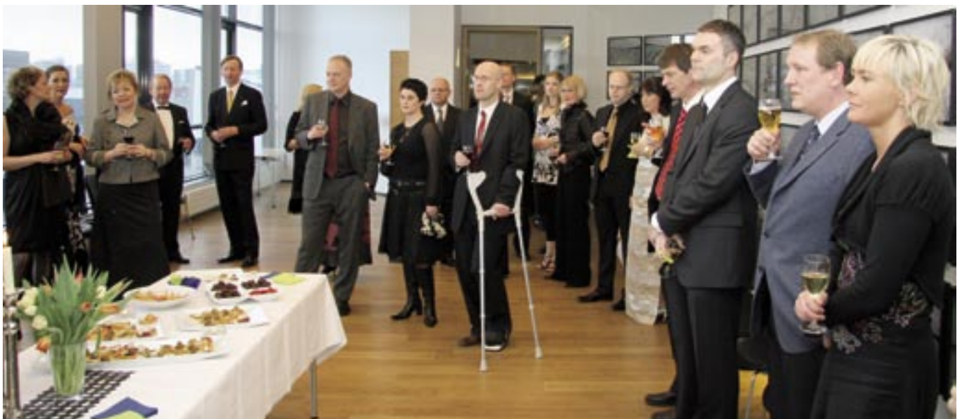
Fyrir árshátíð fóru gestir í móttöku í höfuðstöðvar Kaupþings.