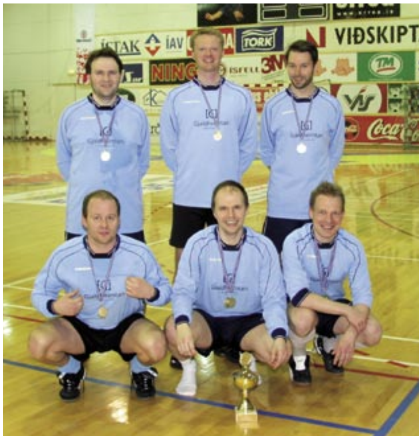
Lið Fullheimtunnar var í fyrsta sæti.