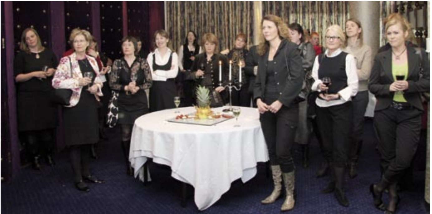
Móttaka var í boði Sólveigar Pétursdóttur, forseta Alþingis. Nokkrir ráðstefnugestir.

með lögmennsku og þingstörfum og lagði áherslu á að þessi störf krefðust góðrar þekkingar á edli starfsins, rétt-sýni og velvildar.