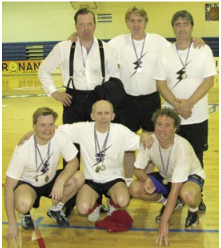
Lið Þrumunnar var í öðru sæti.