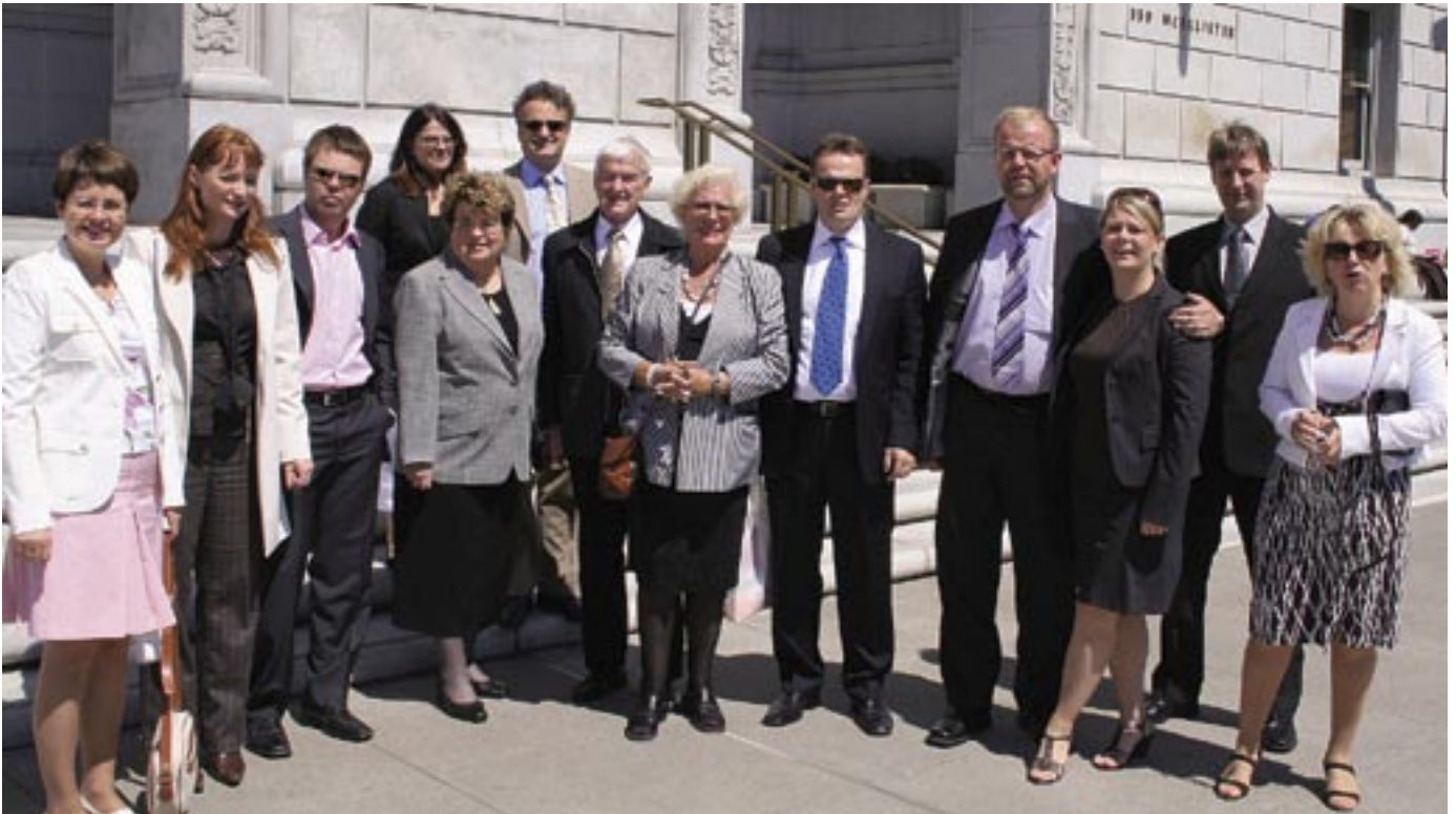
Hluti hópsins fyrir utan Hæstarétt.

enn á ný þurfti að setja töskur á gegnumlýsingarfæriband og losa vasana áður en gengið var í gegnum öryggishlið. Þá loksins var hópnunum treyst til að stíga fæti inn fyrir dyr glæsilegs dómsalar þar sem hátt er til lofts og vítt til veggja.