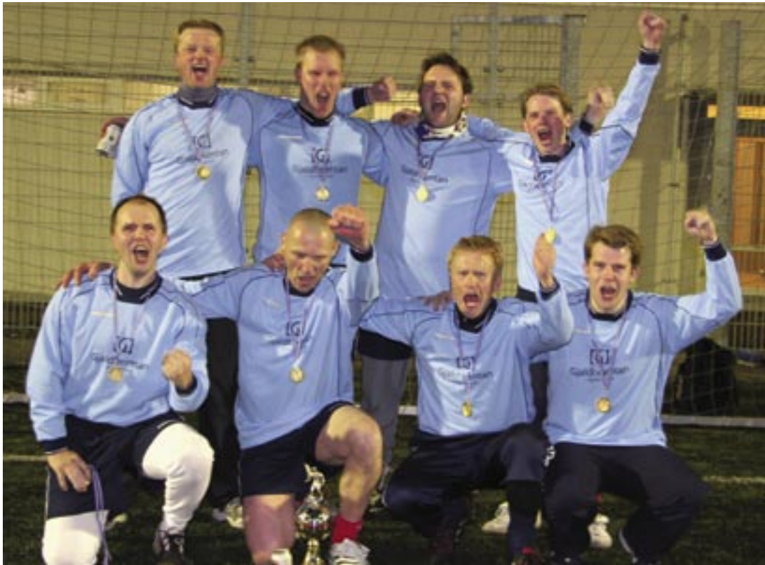
Sigurlið Fullheimtunnar fagnaði gríðarlega óvæntum en verðskulduðum sigri á mótinu.