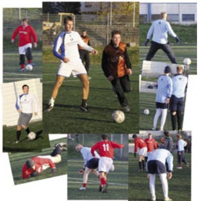
Lögmenn lögðu sig alla fram á knattspyrnuvöllinum við að spyrna boltanum í netið.