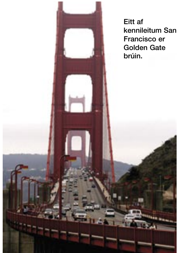
Eitt af kennileitum San Francisco er Golden Gate brúin.