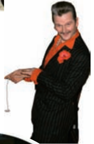
Skari Skrípó sýndi listir sínar og var flottastur!