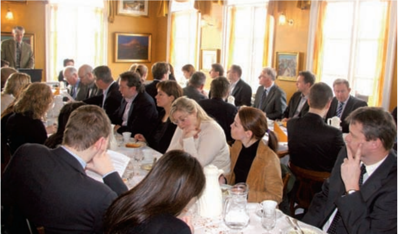
Á milli 50 og 60 manns mættu á fundinn og var húsfyllir, enda hafði efni fundarins verið "fjölmíðlamatur" skömmu fyrir fundinn.