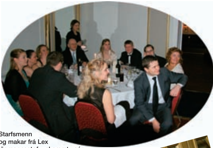
Starfsmenn og makar frá Lex lögmannsstofu, skemmtu sér ágætlega.