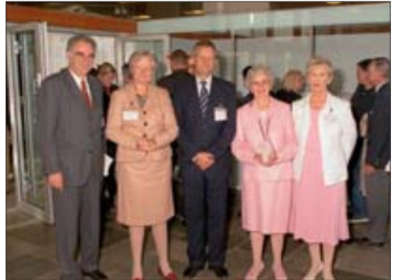
Formenn landsdeilda norrænu lögfræðingapínganna