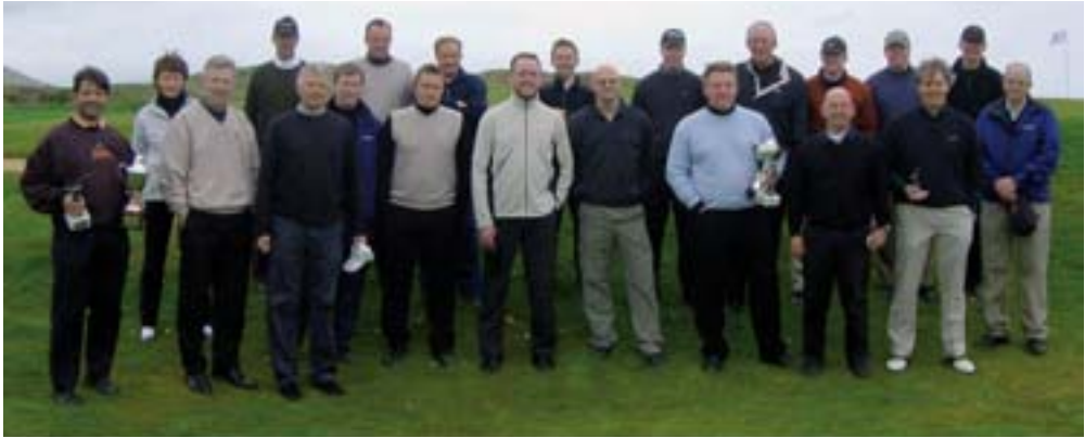
Keppendur á minningarmótinu en fimm höfðu yfirgefið völlinn