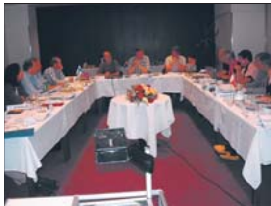
Frá forsætisfundi norrænu lögmannafélaganna á Akureyri í lok ágúst.

Umfjöllunarefni sænska lögmannafélagsins á fundinum varðaði hlutverk lögmanna utan hefð-