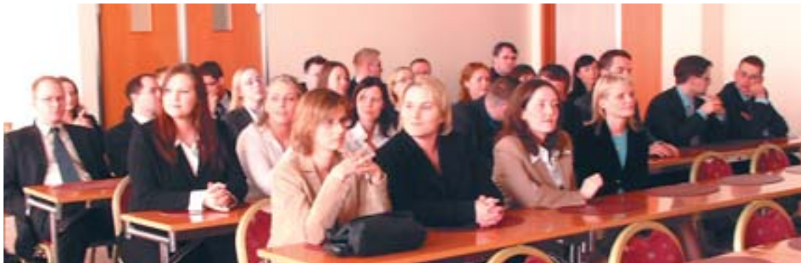
Hluti útskrifarnemenda á hdl-námskeiði vorið 2003 sem dóms- og kirkjumálaráðuneytið stóð fyrir.