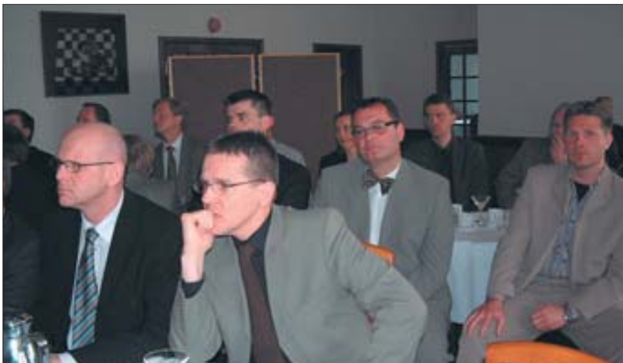
Fundargestir á málþingi LMFÍ og DÍ á Þingvöllum.