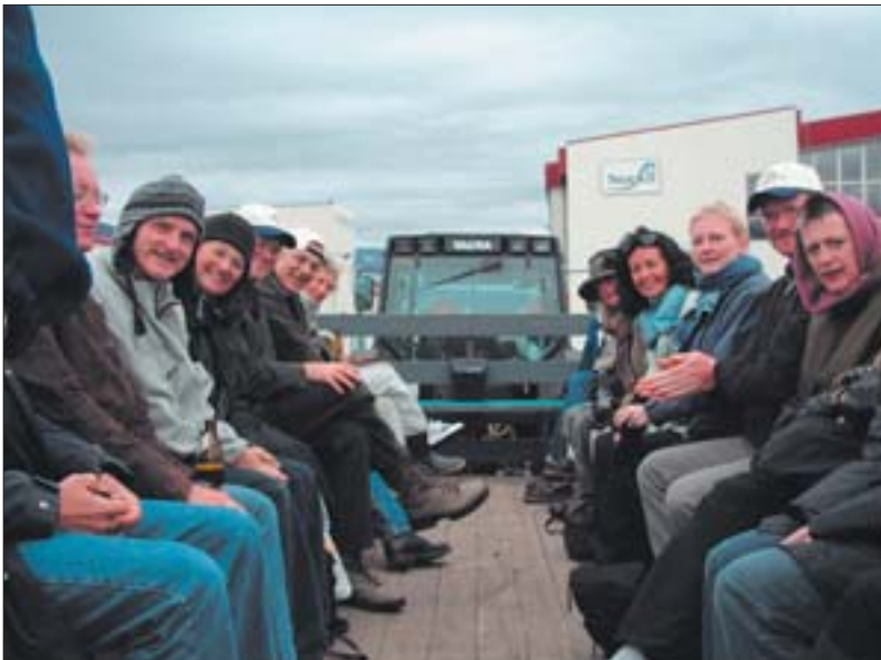
Að loknum fundarhöldum var farið í skemmtiferð um nágrenni Akureyrar. Hér er hópurinn á limmósínu að hríseyskum hætti.

gagnvart skjólstæðingi sínum hefur átt nokkuð undir högg að sækja á undanförunum árum. Þannig hefur löggjöf í Evrópu í vaxandi mæli sett þessari skyldu skorður, nú síðast með breytingu á tilskipun Evrópusambandsins um aðgerðir gegn peningabætti, þar sem víðtækari upplýsingaskylda er nú sett á lögmenn, vakni hjá þeim grunur um að skjólstæðingar þeirra stundi peningabætti. Gengið hefur verið ennþá lengra í Bandaríkjunum, þar sem lögmenn eru nú skyldaðir til að tilkynna yfirvöldum um hugsanleg brot á bókhaldslögum, en þessi herta upplýsingaskylda er afleiðing stórra bókhaldsmisferlismála sem komu upp þar í landi á síðasta ári. Einnig hefur trúnaðarskyldu lögmanna verið sett frekari takmörk í Bandaríkjunum í málum þar sem grunur leikur á tengslum skjólstæðings við hryðjuverka-