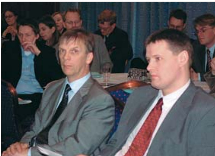
Fundarmenn á aðalfundi 2003.

Þjálfun lögmanna, þar með talið endurmenntun og benti jafnframt á að slík skylda væri víða komin á s.s. í Bandaríkjunum, Englandi, Noregi og Finnlandi. Væri rétt að félagið ætti frumkvæði að endurmenntunarskyldu, fremur en taka afleiðingum þróunar að utan, enda virtist spurningin fremur vera með hvaða hætti skyldunni verði komið á og hvert inntak hennar verði en hvort endurmenntunarskylda kæmist á. Minnti formaðurinn á að samkvæmt siðareglum væri mönnum í raun lögð slík skylda á herðar en svo virtist sem það dygði ekki til.