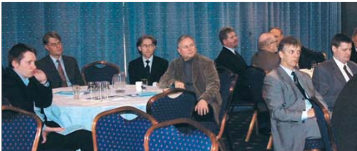
Fundarmenn á aðalfundi 2003.

liðum sem tóku miklum breytingum eða kölluðu að öðru leyti á sérstaka umfjöllun, þar sem hann upplýsti m.a. að útistandandi árgjöld félagsins hefðu lækkað um 1,2 milljónir króna, sem aðallega mætti rekja til róttækra innheimtuaðgerða gagnvart skuldurinum.