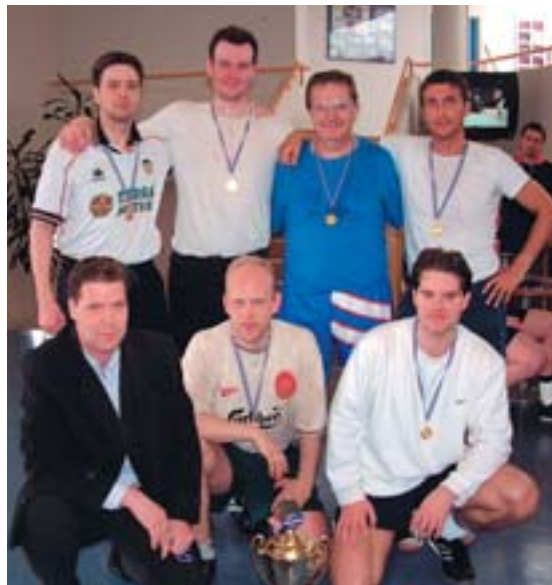
Hið sigursæla lið, Reynsla og léttleiki, hampar hér glaðlega bikarnum.